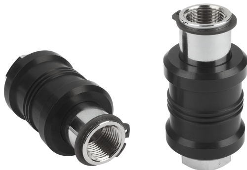
Valvole a cassetto manuale HSV